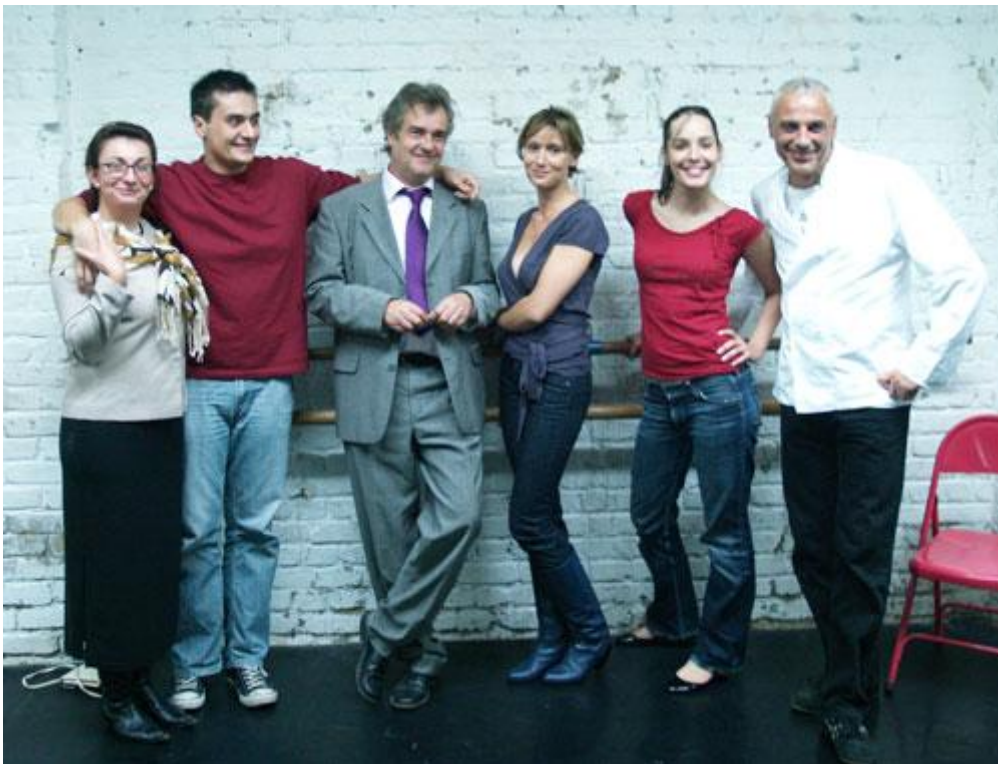
l'équipe de Love in the city (ou KEBAB.COM) en répétition – oct 2008

DFQM SPECTACLES produit des spectacles vivants : « De toutes les couleurs » au Petit Gymnase en 2006, « Recherche Meuf désespérément » aux Planches du Canal et au Lieu depuis 2007 et « Love in the city » au Guichet Montparnasse en 2008 et au Blancs-Manteaux en 2009